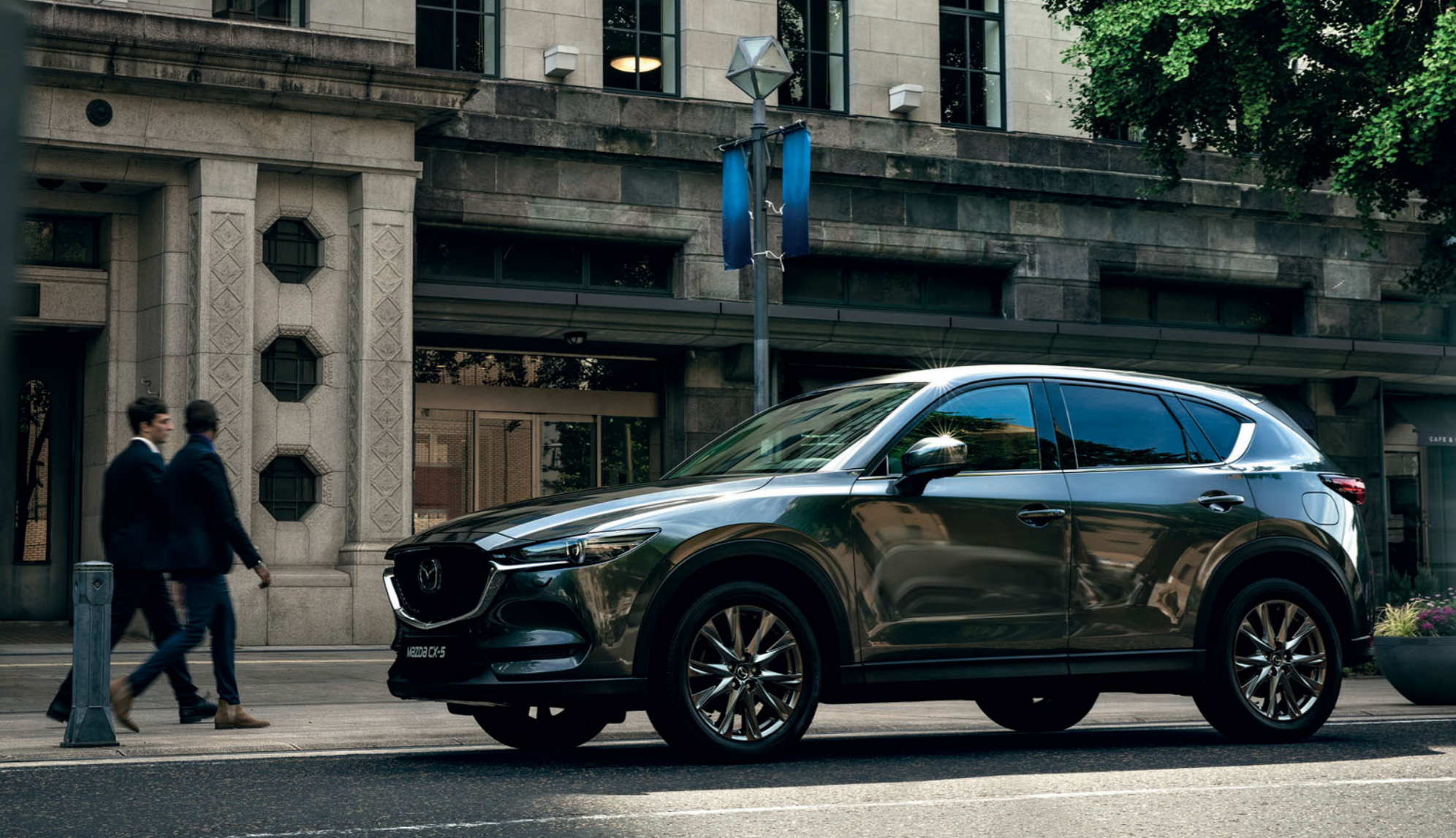
Foto boven: Mazda CX-5 als Signature uitvoering in Machine Gray Metallic