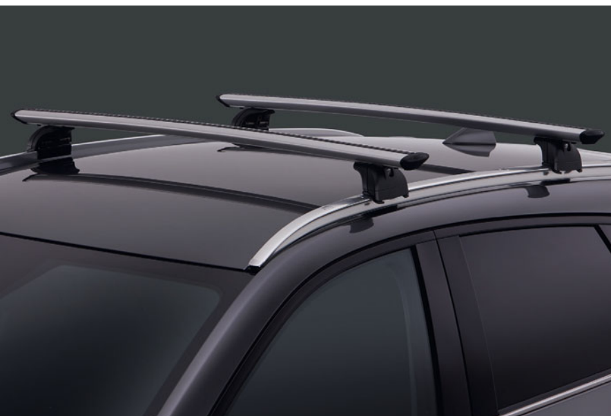
Dakrails & Dakdragers

Met veel zorg heeft Mazda dealeropties ontworpen die perfect bij uw Mazda CX-5 passen. Ga voor een volledige lijst met originele Mazda dealeropties voor de Mazda CX-5 naar onze website.