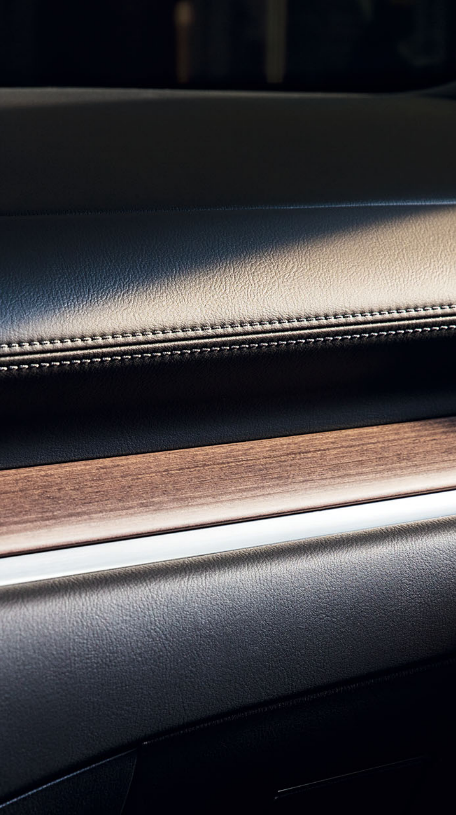
Foto links: interieurlijsten uitgevoerd in Japans Sen-hout, op Signature uitvoering Foto rechts: Interieur Mazda CX-5 als Signature uitvoering