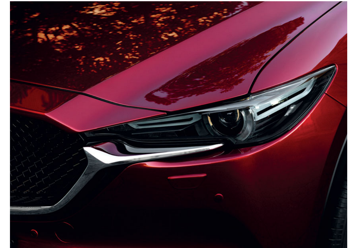
Foto boven: Signature koplampen, standaard op Comfort uitrusting Foto links: Mazda CX-5 in Soul Red Crystal