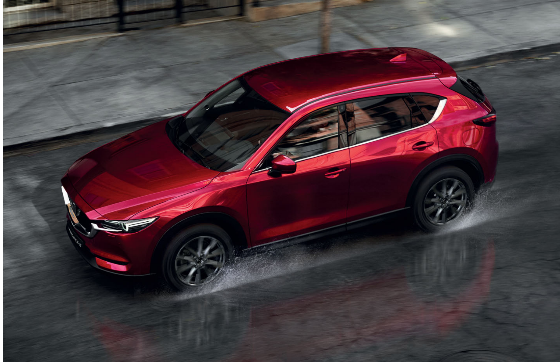
Foto boven: Mazda CX-5 als Signature uitvoering in Soul Red Crystal