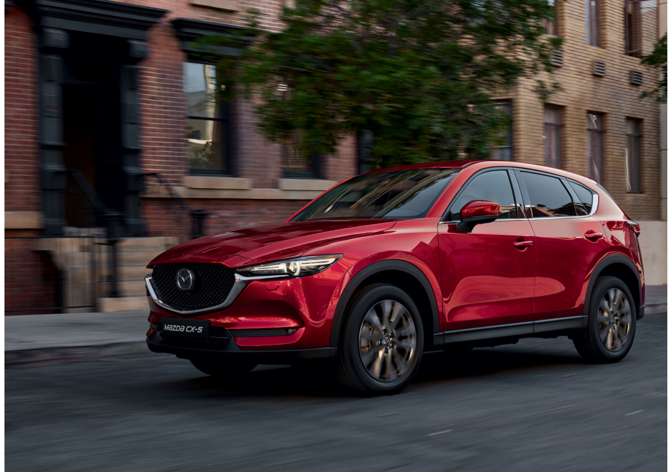
Foto rechts: Mazda CX-5 als Signature uitvoering in Soul Red Crystal