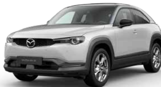
CERAMIC METALLIC 3-TONE