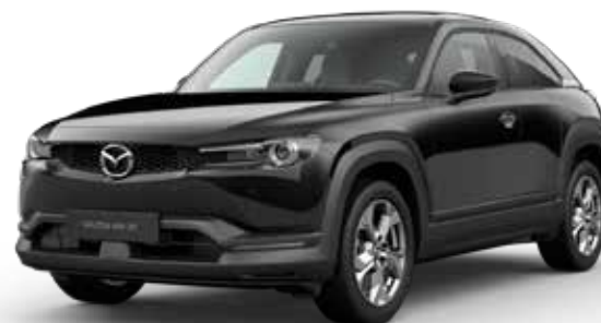
JET BLACK MICA

Je hebt de keuze uit acht kleurvarianties. Arctic White Solid vormt de basis. Bijzonder zijn de drie Metallic 3-tone-samenstellingen, met Ceramic, Polymetal Gray of Soul Red Crystal als basis. Doordat de zijpanelen zijn afgewerkt in Silver of Dark, wordt een moderne look gecreëerd die de suggestie wekt dat donker en licht samenvallen.