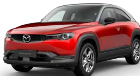
SOUL RED CRYSTAL METALLIC 3-TONE