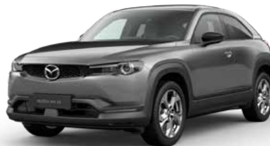
MACHINE GRAY METALLIC