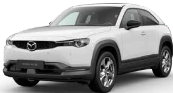
ARCTIC WHITE SOLID