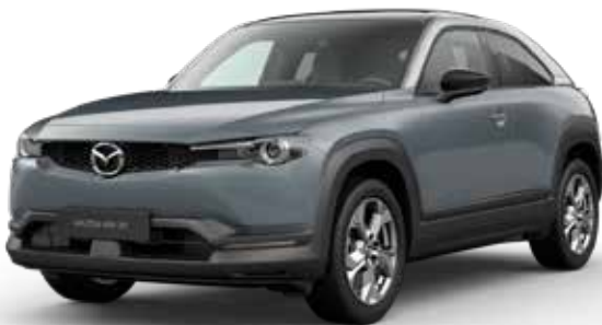
POLYMETAL GRAY METALLIC 3-TONE