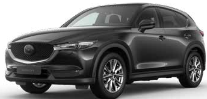
JET BLACK MICA