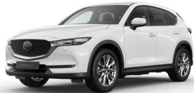
ARCTIC WHITE SOLID