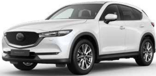
SNOWFLAKE WHITE PEARL