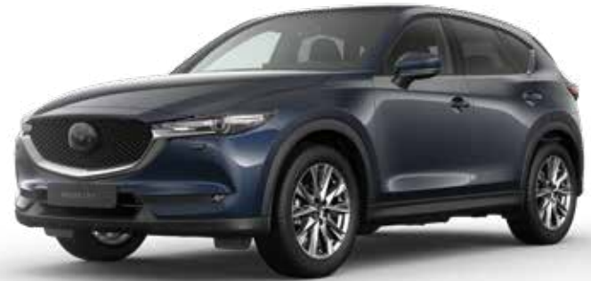
DEEP CRYSTAL BLUE MICA