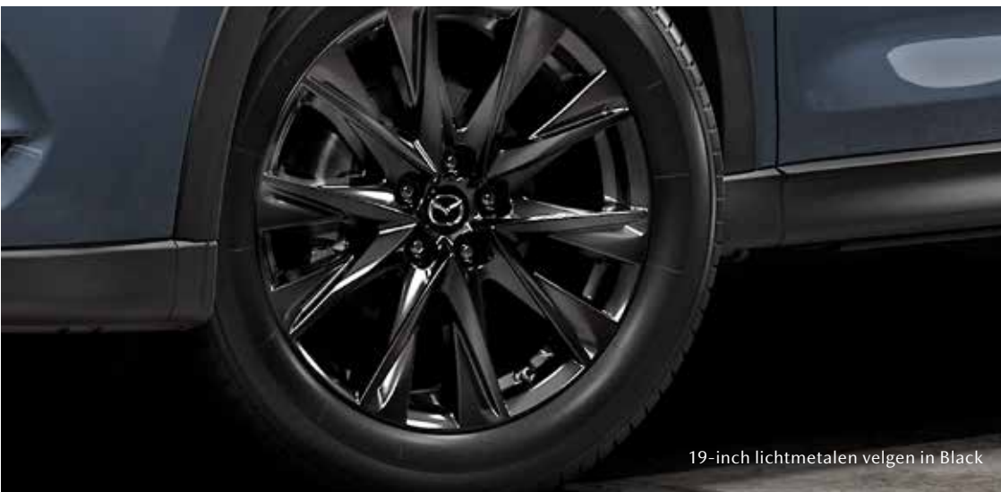
19-inch lichtmetalen velgen in Black