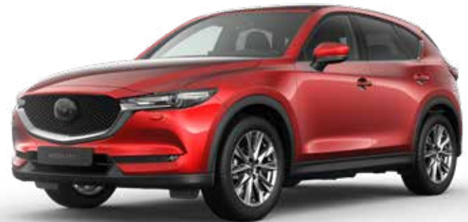
SOUL RED CRYSTAL METALLIC