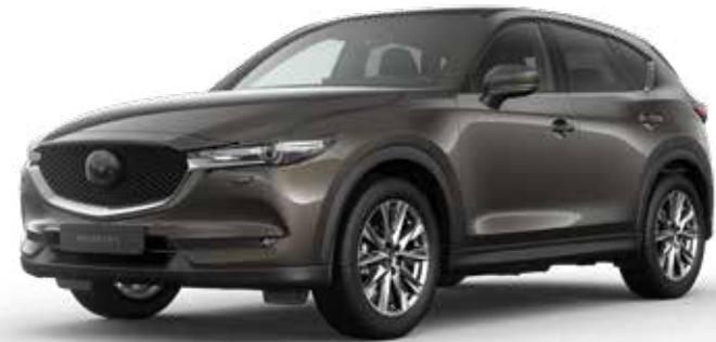
TITANIUM FLASH MICA