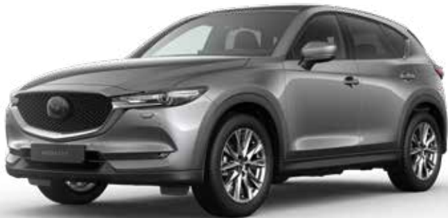
MACHINE GRAY METALLIC