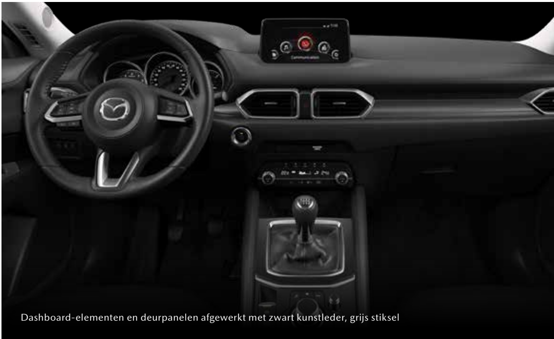
Dashboard-elementen en deurpanelen afgewerkt met zwart kunstleder, grijs stiksel