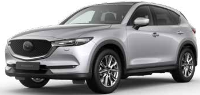
SONIC SILVER METALLIC