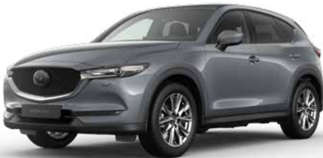
POLYMETAL GRAY METALLIC

Je hebt de keuze uit tien kleuren. Arctic White Solid vormt de basis. Machine Gray Metallic en Soul Red Crystal Metallic zijn het meest exclusief. Een speciale laktechniek met nog kleinere en heldere aluminiumdeeltjes zorgt voor een ongekend diepe, heldere kleur.