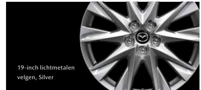
19-inch lichtmetalen velgen, Silver