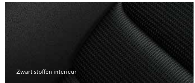
Zwart stoffen interieur