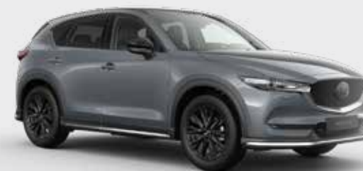
Mazda CX-5 met Sport pakket