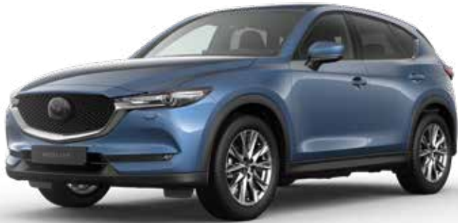
ETERNAL BLUE MICA