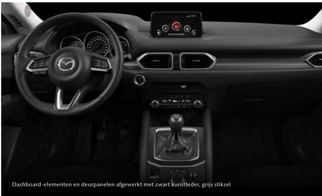
Dashboard-elementen en deurpanelen afgewerkt met zwart kunstleder, grijs stiksel