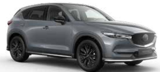
Mazda CX-5 met Sport pakket