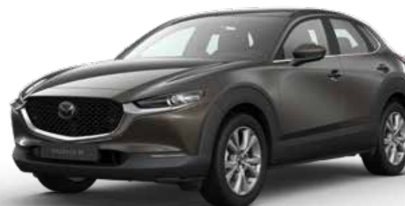
TITANIUM FLASH MICA € 800