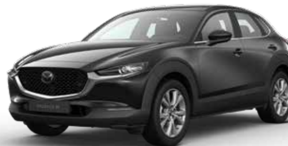
JET BLACK MICA € 800