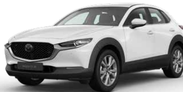
ARCTIC WHITE SOLID

Je hebt keuze uit negen kleuren. Arctic White Solid vormt de basis. Machine Gray Metallic en Soul Red Crystal Metallic zijn het meest exclusief. Een speciale laktechniek met nog kleinere en heldere aluminiumdeeltjes zorgt voor een ongekend diepe, heldere kleur.