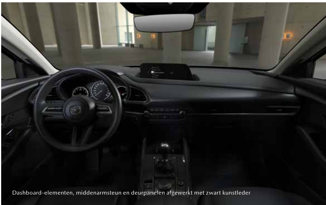
Dashboard-elementen, middenarmsteun en deurpanelen afgewerkt met zwart kunstleder