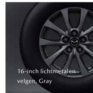
16-inch lichtmetalen velgen, Gray