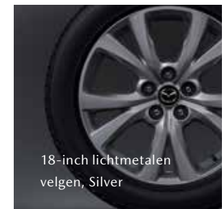
18-inch lichtmetalen velgen, Silver