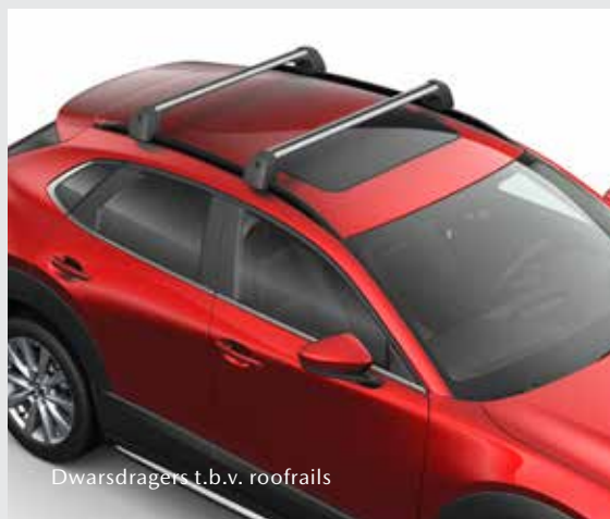
Dwarsdragers t.b.v. roofrails