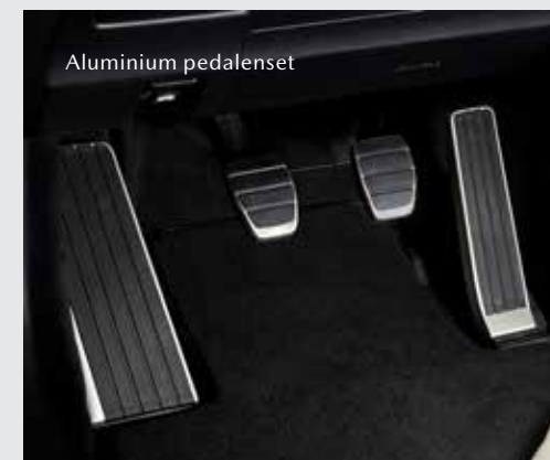
Aluminium pedalen, incl. voetsteun