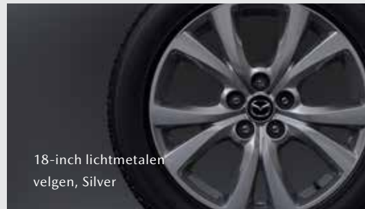
18-inch lichtmetalen velgen, Silver