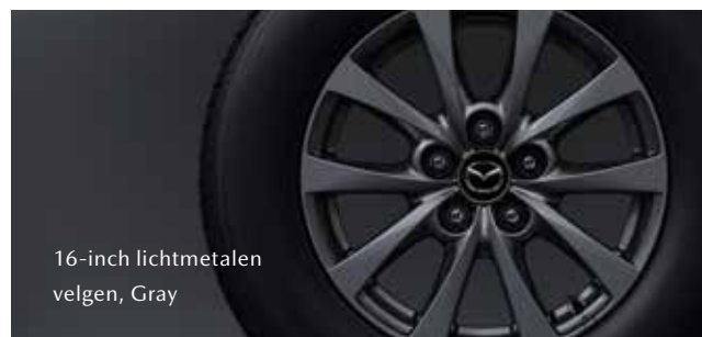
16-inch lichtmetalen velgen, Gray