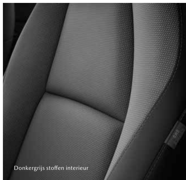
Donkergrijs stoffen interieur