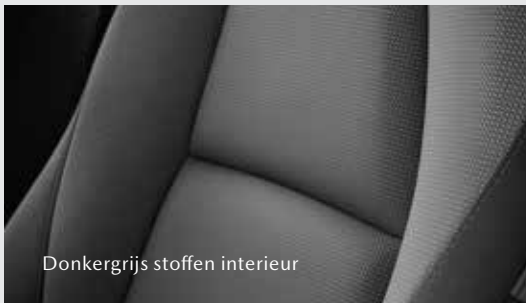
Donkergrijs stoffen interieur