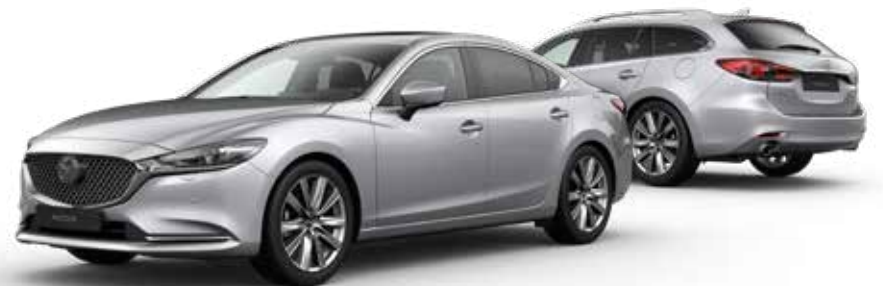
SONIC SILVER METALLIC € 900