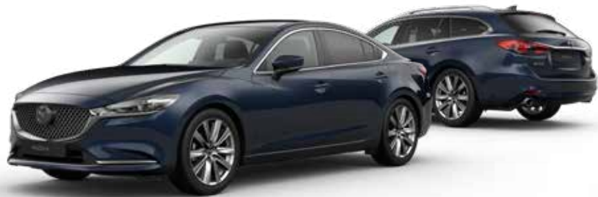
DEEP CRYSTAL BLUE MICA € 900