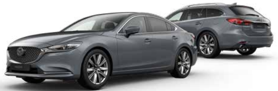
POLYMETAL GRAY METALLIC