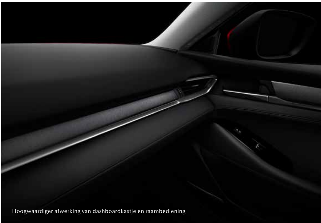
Hoogwaardiger afwerking van dashboardkastje en raambediening