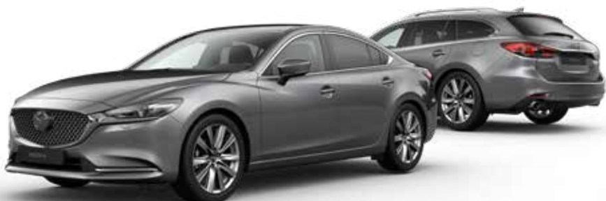
MACHINE GRAY METALLIC € 1.100