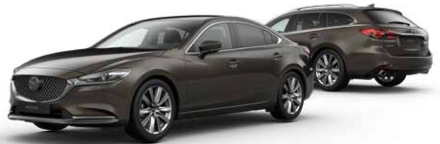
TITANIUM FLASH MICA