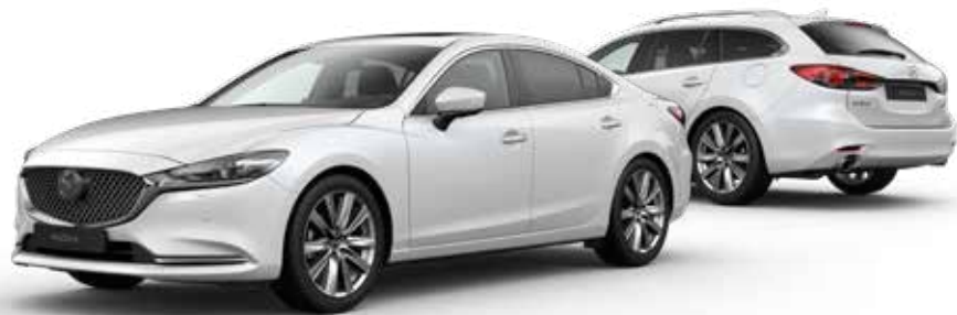
SNOWFLAKE WHITE PEARL € 900