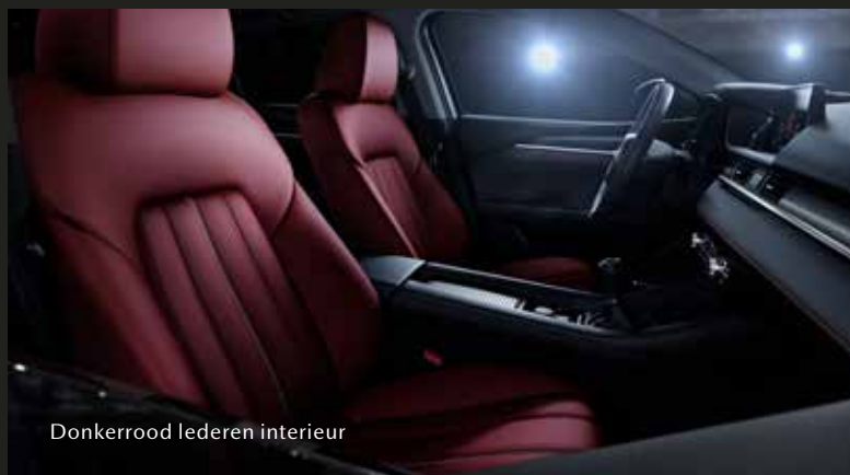
Donkerrood lederen interieur