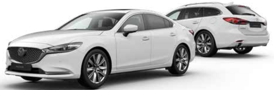
ARCTIC WHITE SOLID

Bekijk de Mazda6 Sportbreak in 360 graden