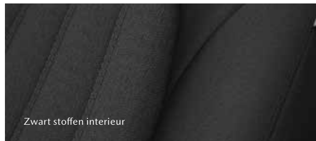
Zwart stoffen interieur