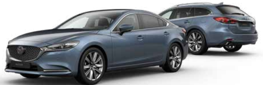
BLUE REFLEX MICA € 900