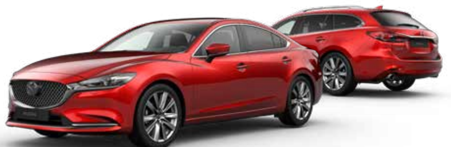
SOUL RED CRYSTAL METALLIC € 1.250