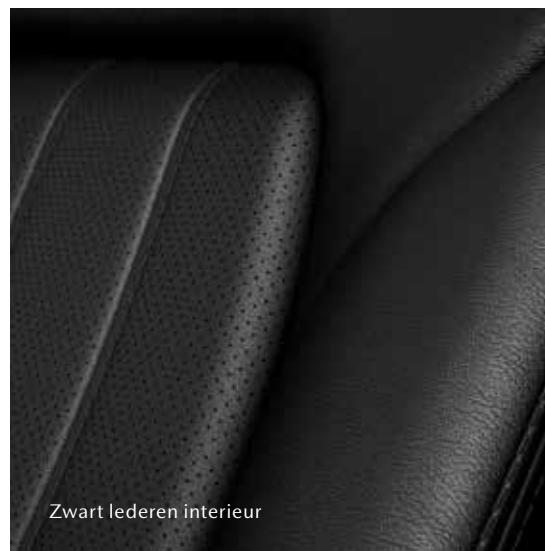
Zwart lederen interieur