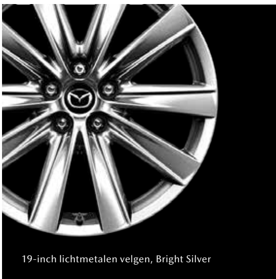
19-inch lichtmetalen velgen, Bright Silver