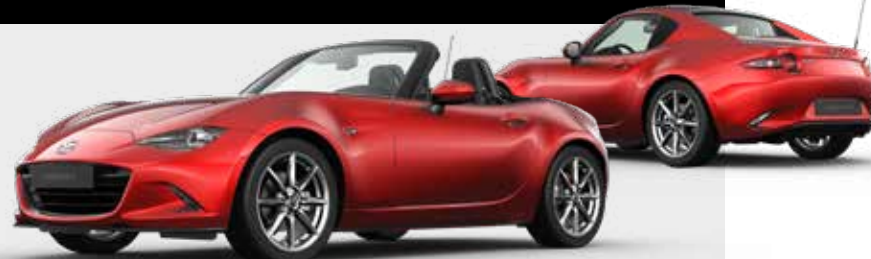
SOUL RED CRYSTAL*** € 1.200