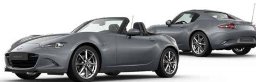
POLYMETAL GREY** € 850