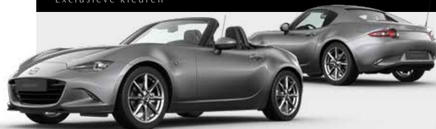
MACHINE GREY € 1.050