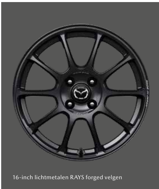
16-inch lichtmetalen RAYS forged velgen