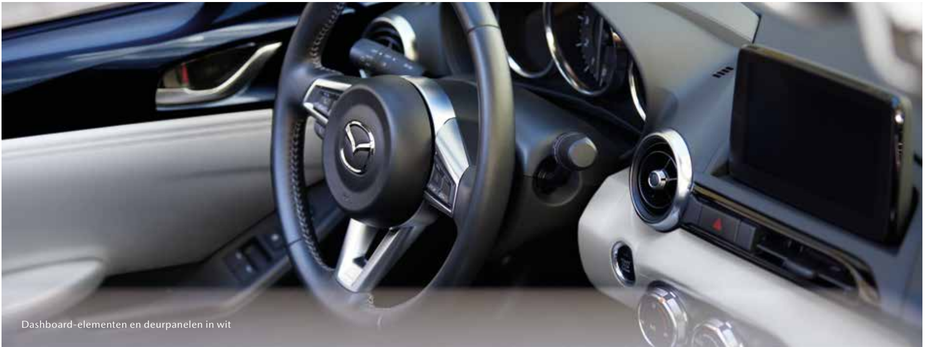
Dashboard-elementen en deurpanelen in wit