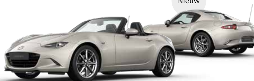
PLATINUM QUARTZ € 850