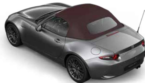
Mazda MX-5 Roadster Signature in Machine Grey met donkerrode softtop

Niet beschikbaar in combinatie met de exterieurkleuren Polymetal Grey en Soul Red Crystal (Roadster) of Jet Black (RF).