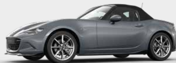
Mazda MX-5 Roadster met Sport Pakket