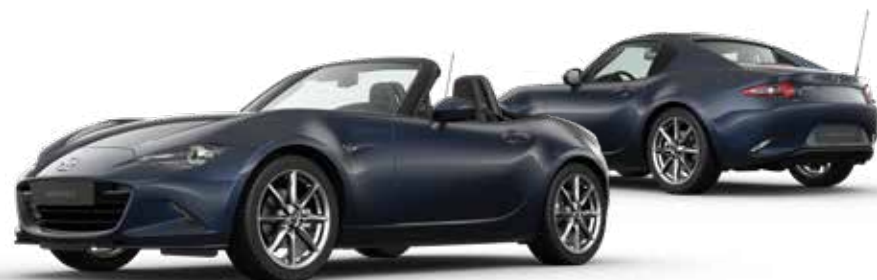
DEEP CRYSTAL BLUE € 850