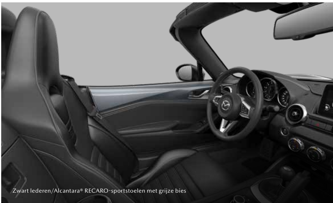
Zwart lederen/Alcantara® RECARO-sportstoelen met grijze bias