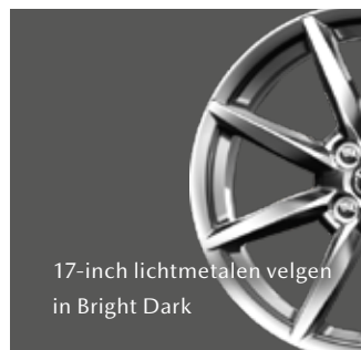
17-inch lichtmetalen velgen in Bright Dark