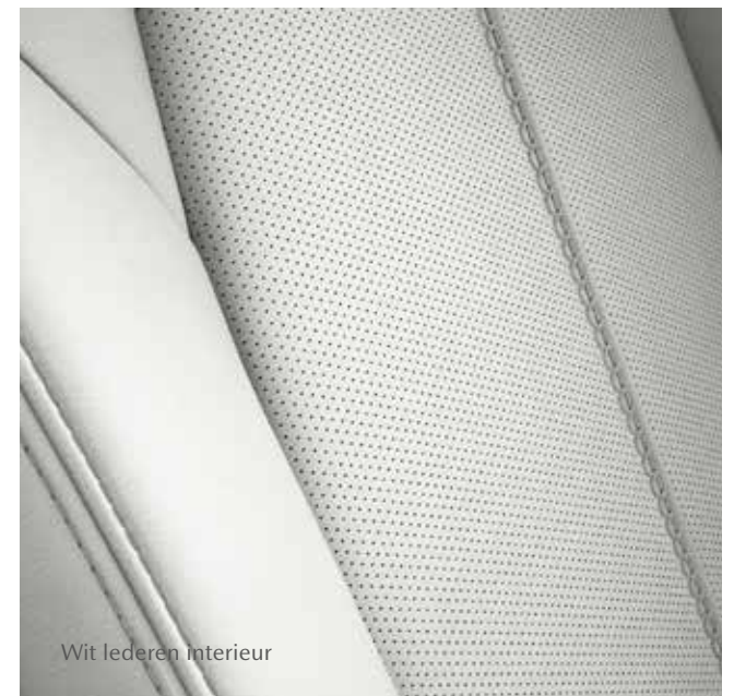
Wit lederen interieur