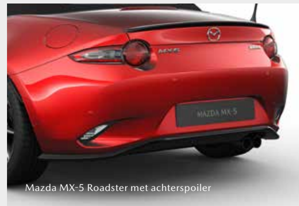
Mazda MX-5 Roadster met achterspoiler