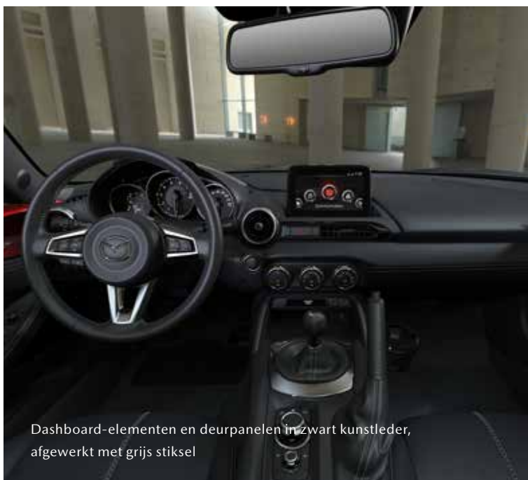
Dashboard-elementen en deurpanelen in zwart kunstleder, afgewerkt met grijs stiksel