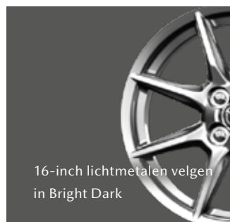
16-inch lichtmetalen velgen in Bright Dark