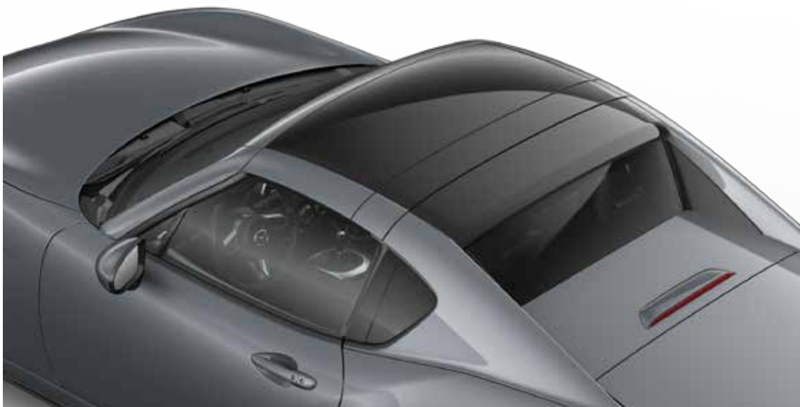
Mazda MX-5 RF Sportive in Polymetal Grey met Twin Tone dak