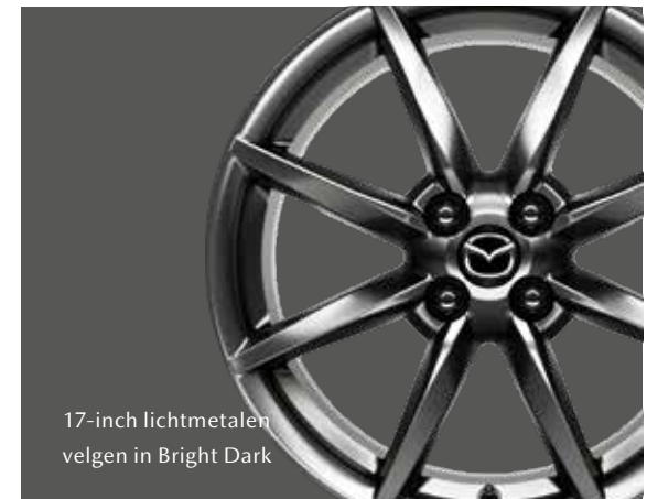
17-inch lichtmetalen velgen in Bright Dark

Niet beschikbaar in combinatie met exterieurkleur Jet Black (RF).