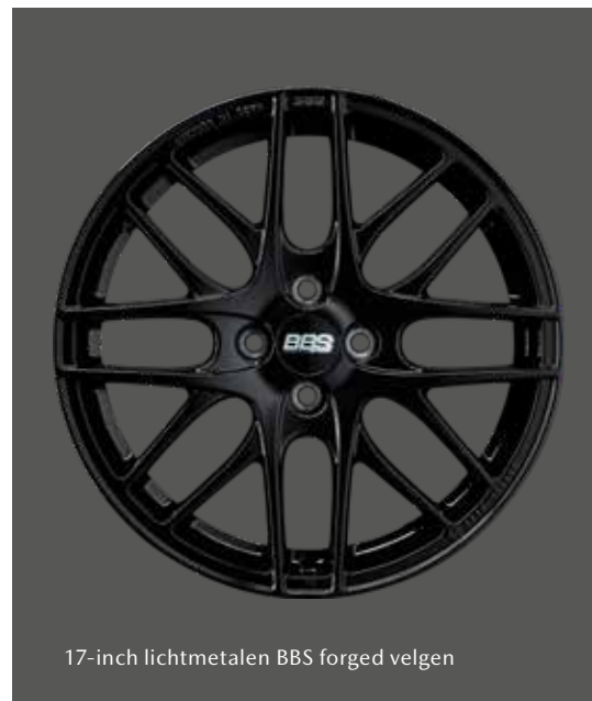
17-inch lichtmetalen BBS forged velgen